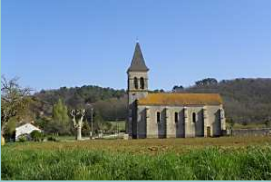
église de Loupiac