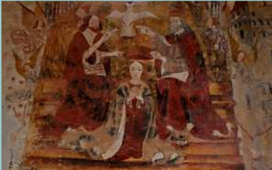
Fresque - église Martignac