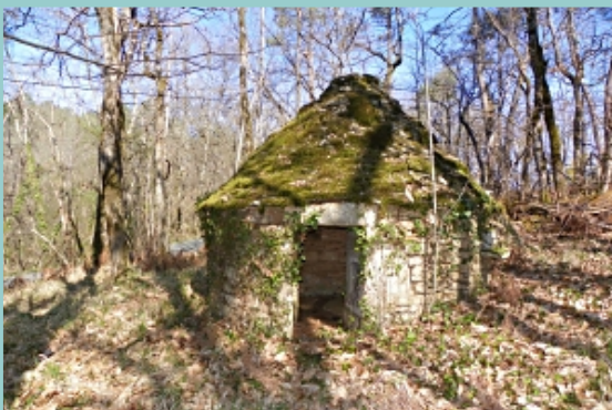
Gariotte en descendant vers Cazes