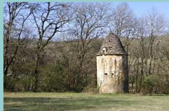
Pigeonnier entre Puy l'Evêque et Loupiac