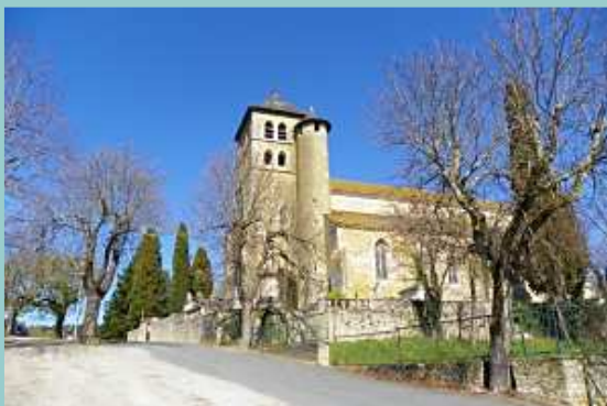
église St Sauveur de Puy l'Evêque