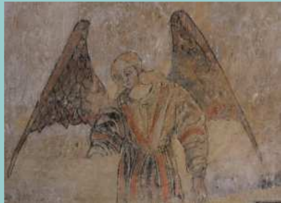
Fresque - église Martignac