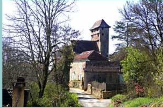
église de Martignac