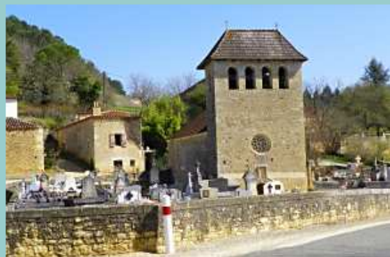
église de Cazes