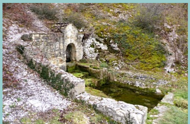
faire un A/R pour voir Font Basse