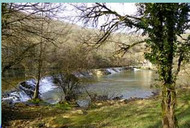
la chaussée du moulin de Peyre