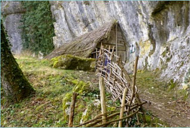
la "loge végétale" de Caoulet