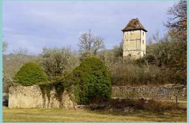
pigeonnier après Caoulet