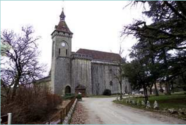
le Château de Rocamadour