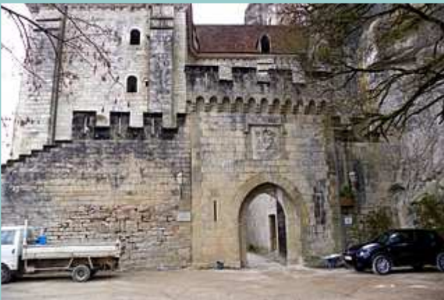
entrée du sanctuaire depuis le chemin de croix