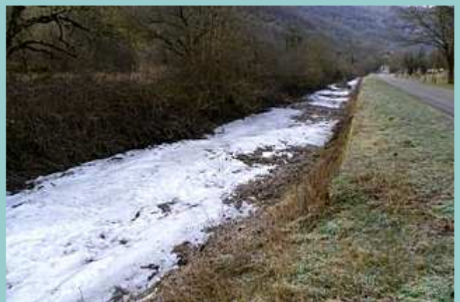
23 Fevrier 2012, l'Alzou gelée