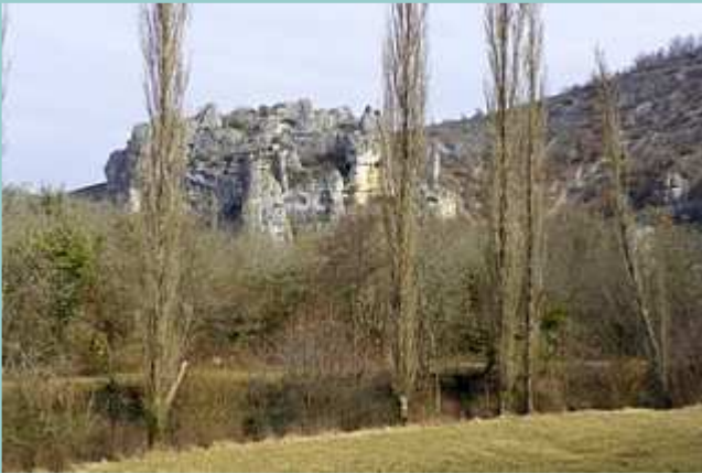
rocher de la vallée de l'Ouyse