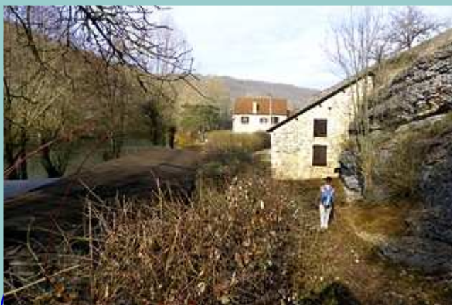
l'arrivée au moulin de Caoulet