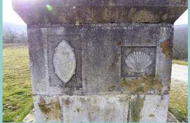
Sportelle et coquille sur la Croix de Cruzol