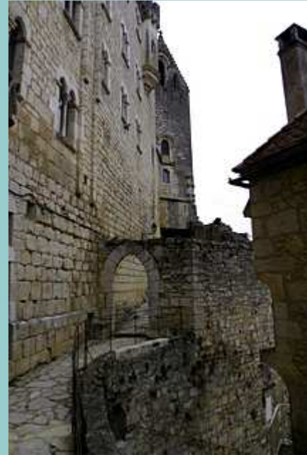
une vue du sanctuaire

Splendide circuit que l'on ne regrettera pas.