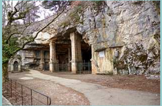
la grotte du chemin de croix