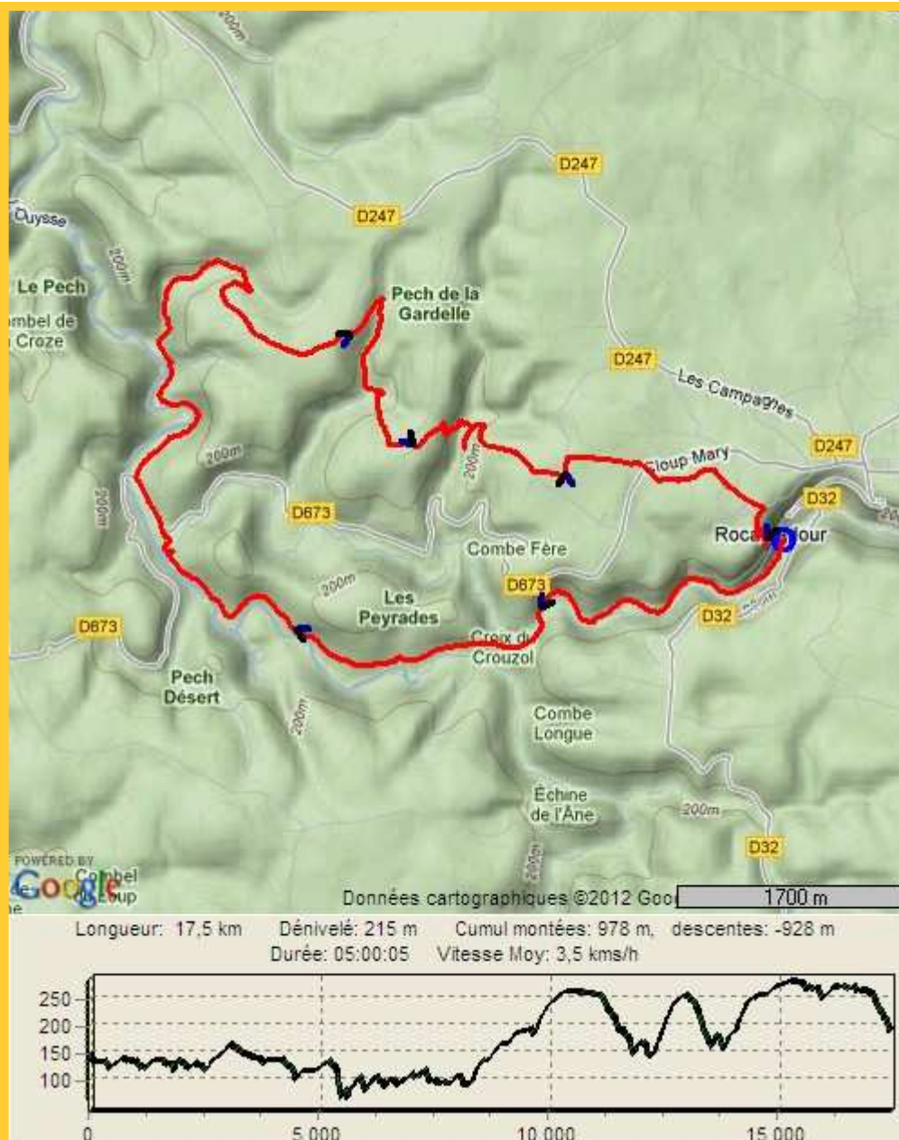
Image obtenue avec le logiciel gratuit GpxTraceNet v5.1 http://www.qpspassion.com/upload2/teepy_GpxTraceNet.zip

Réalisées avec la trace récupérée par un GPS Garmin etrex Venture HC