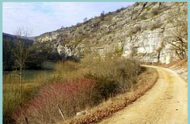
la piste le long de l'Alzou