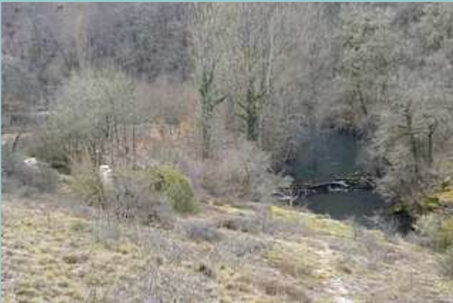
chaussée du moulin de Cabouy