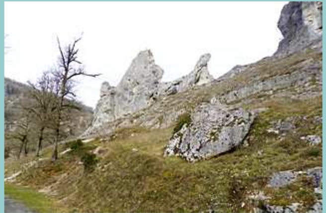
rocher de la vallée de l'Ouyse