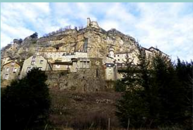
Rocamadour vue du parking des bords de l'Alzou