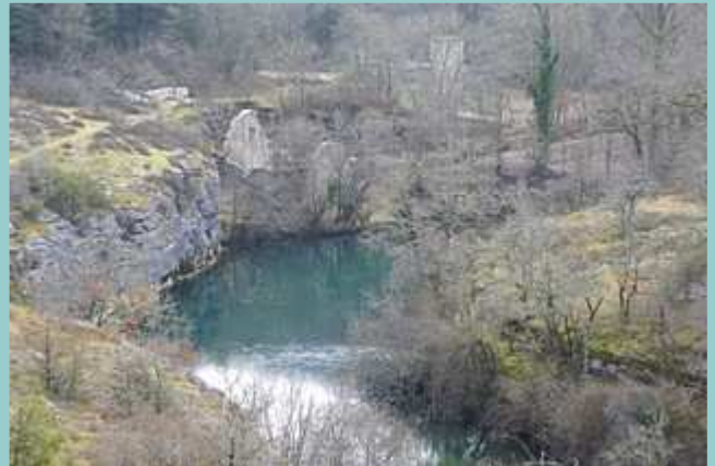
les ruines du moulin de cabouy