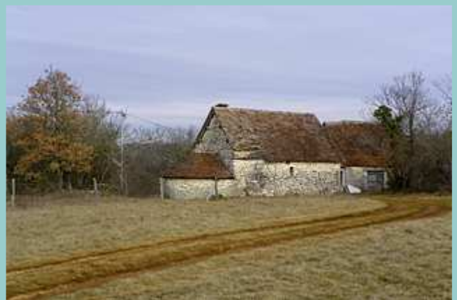
four à pain de La Vitalie