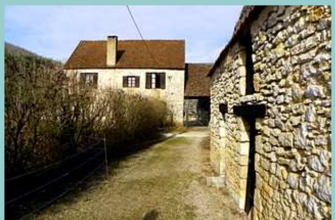
le moulin de Caoulet