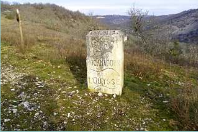
La borne à l'escargot au Col de Magès