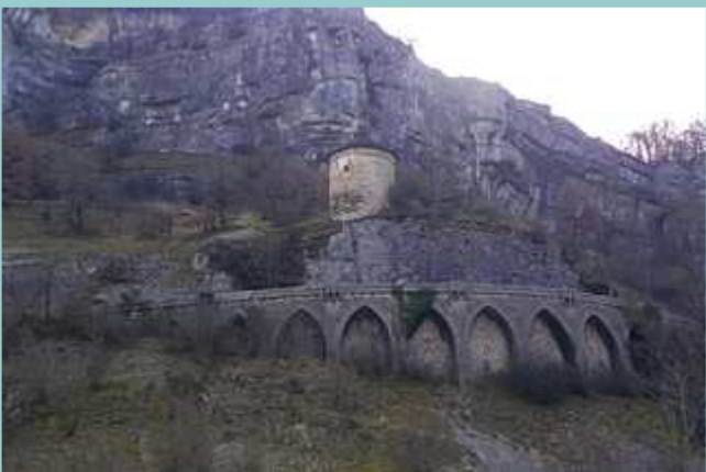
le pigeonnier au-dessus de la route de Carluçet