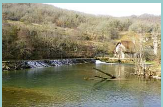
le moulin de Peyre