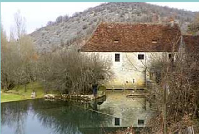
moulin de Cougnaguet