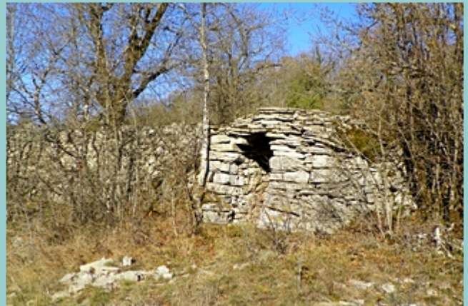
petite gariotte qui tourne le dos au chemin