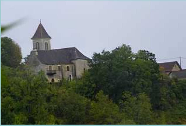
l'église de Magnagues