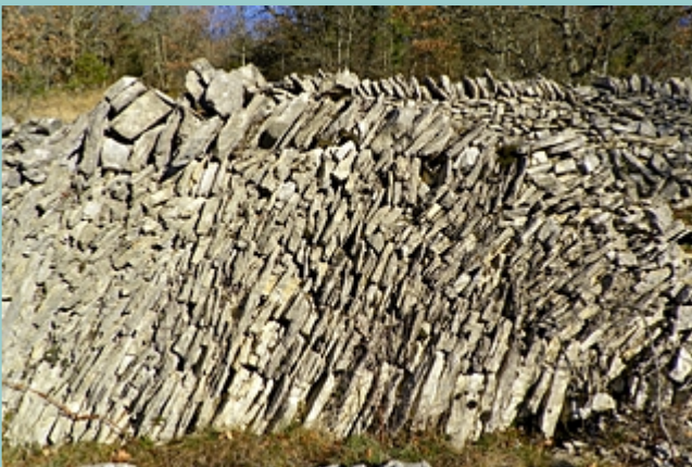
mur aux pierres agencées de manière particulière