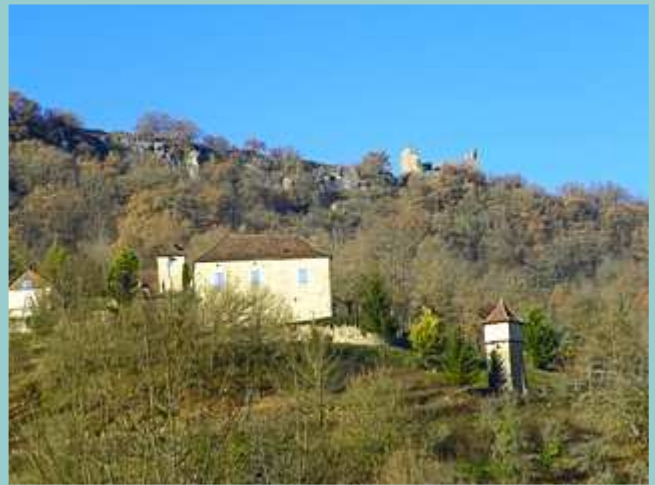
sur la crête, les ruines du château de Taillefer