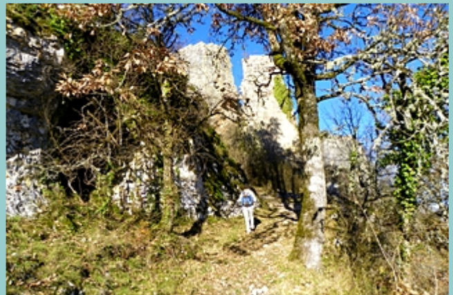
l'arrivée aux ruines