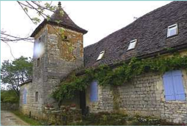
beau pigeonnier au Puy del Claux