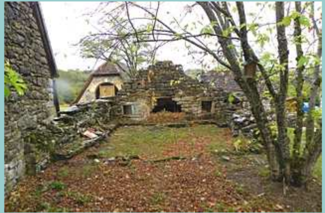
four ruiné au Puy del Claux