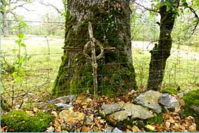
petite croix de banchage et couronne de clématite sauvage