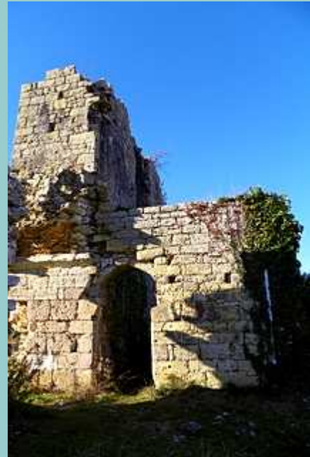
les ruines du château de Taillefer