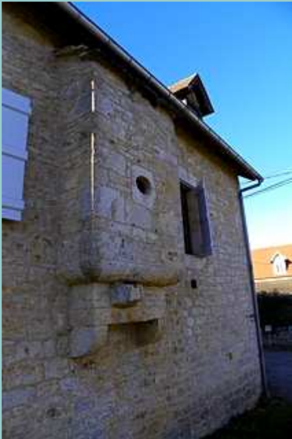
maison à Laguizayrie