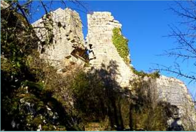
au bas des ruines