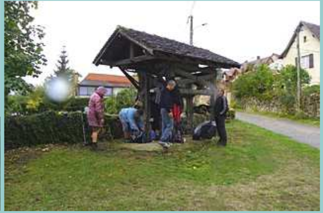
le travail qui abrita la pose de midi