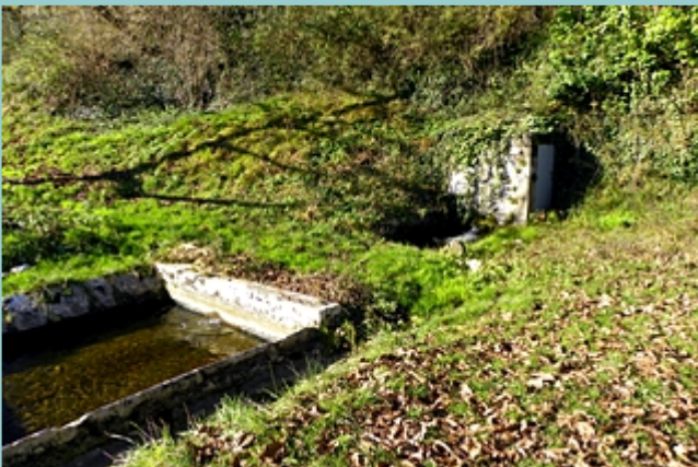
la fontaine et son lavoir sur le chemin qui monte aux ruines