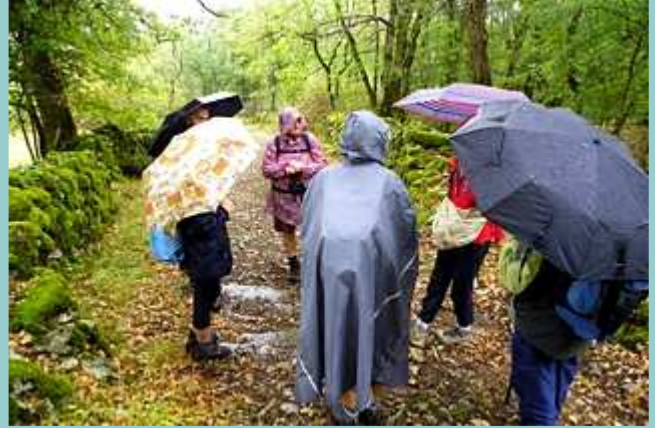
la pause de 10h ... un peu humide !