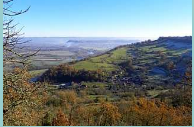
point de vue sur la vallée