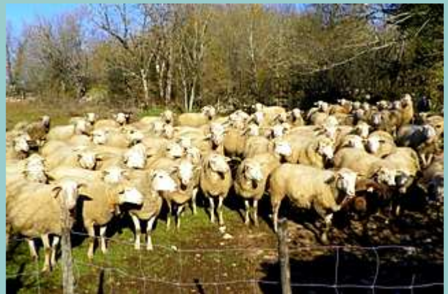
les habitantes du causse