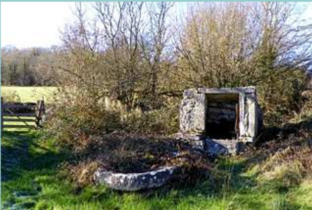
fontaine et son auge