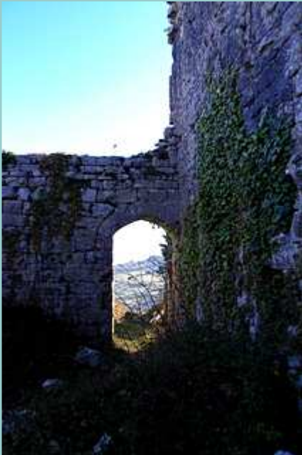
les ruines du château de Taillefer