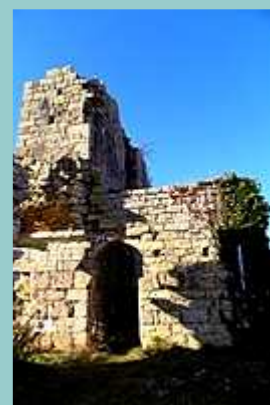
Les ruines de Taillefer

Image obtenue avec le logiciel gratuit GpxTraceNet v5.4 http://www.gpspassion.com/upload2/teepy_GpxTraceNet.zip