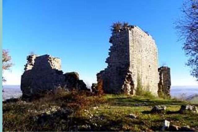
les ruines du château de Taillefer