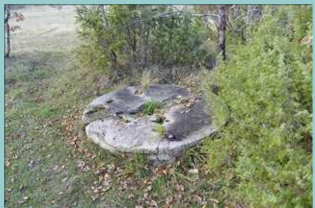
vieille meule du Moulin de Bagor