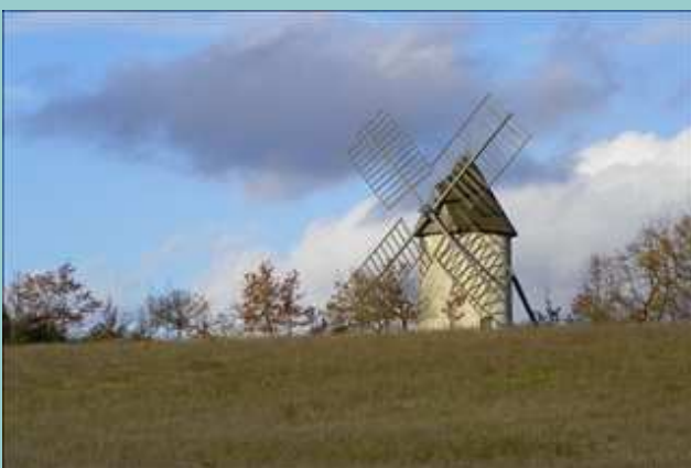
Le Moulin de Bagor