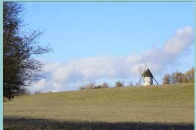
Le Moulin de Bagor à l'horizon