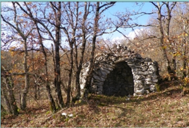
gariotte au dessus du moulin Bessou