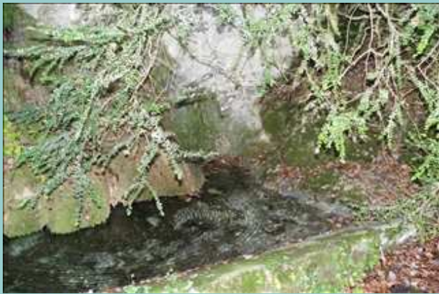
la fontaine au-dessus du Théron