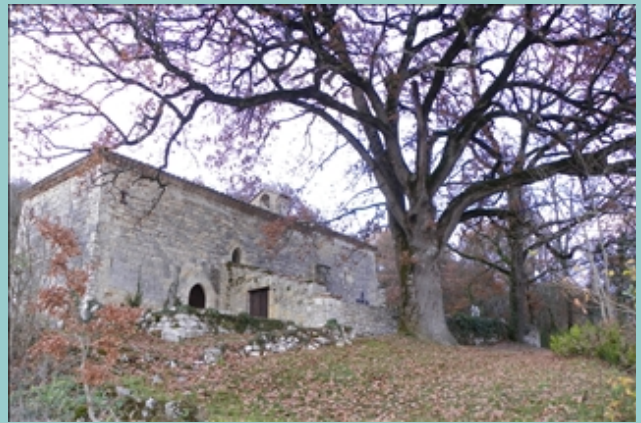
la chapelle de Saint Aignan