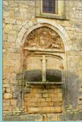
église de Goujounac, tympan