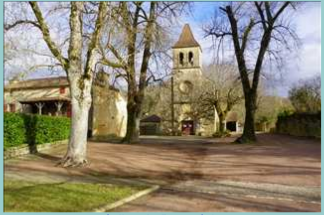
église de Pomarède