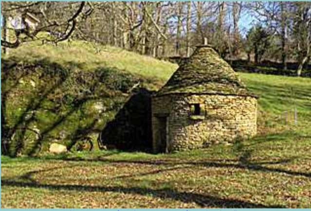
gariotte après la raversée de la D673