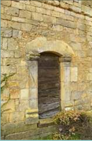
église de Goujounac, porte latérale