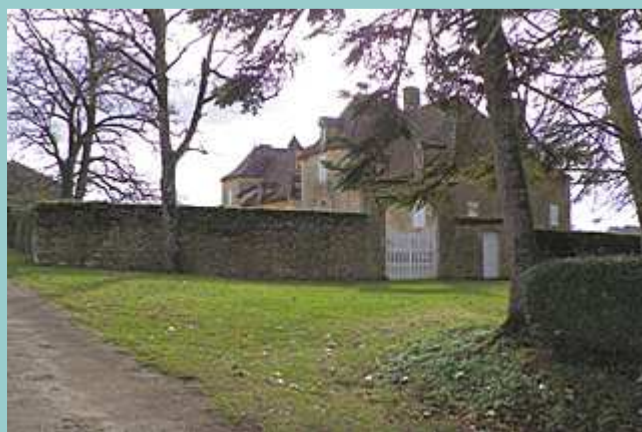
château de Pech Fumat