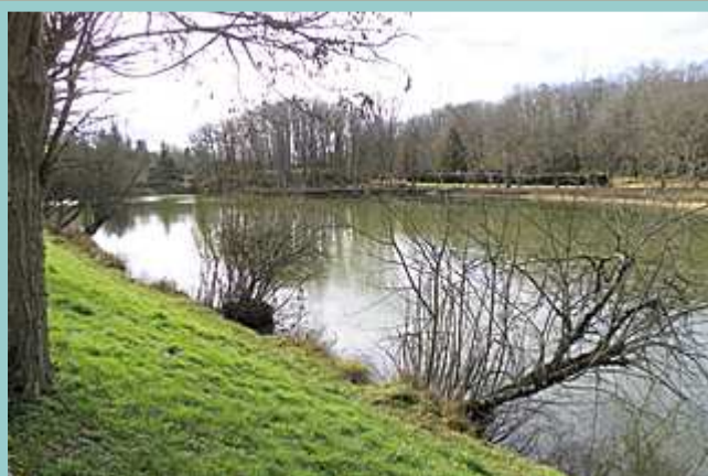
lac de Frayssinet le Gélat