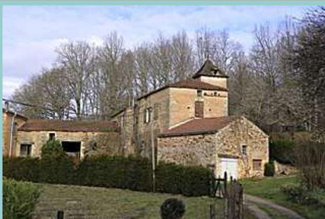
vieille ferme aux Pattaris