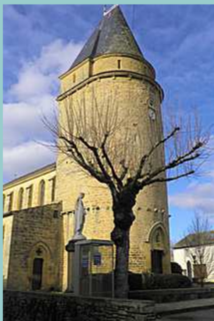
église de Frayssinet le Gélat