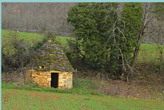
gariotte au départ de Goujounac