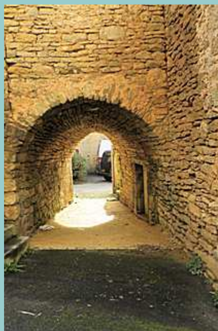
le passage voûtée de Frayssinet le Gélat