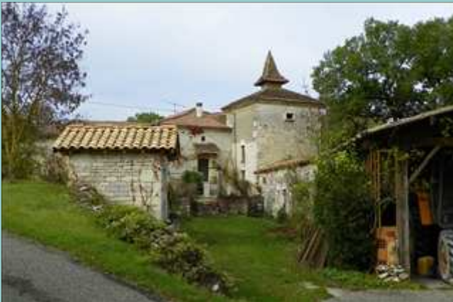
ferme au bout de la cote menant au moulin de Boisse