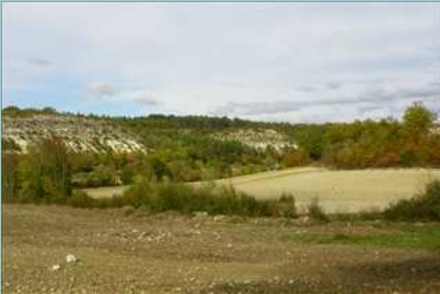
le Causse Blanc

http://www.tourisme-lot.com/fr/114/13/0/0/sit/index/Randonnees-Pedestre/balades-et-randonnees?&ext=,DIFF,0,%3E12,46248,-!