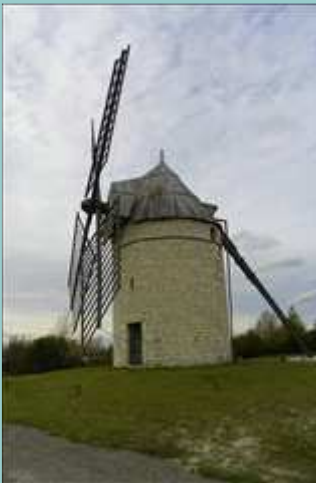
Le moulin de Boisse