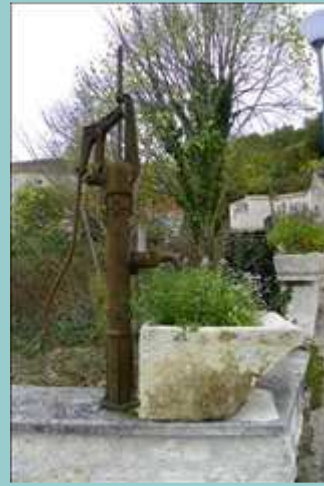
vieille pompe à Ste Alauzie