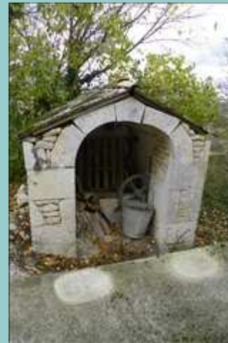
puits à Ste Alauzie