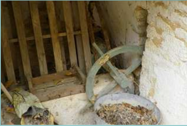
mécanisme du puits de Ste Alauzie