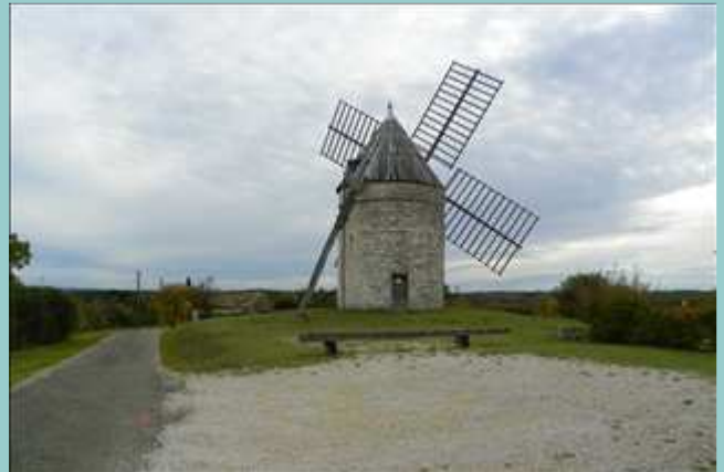
le moulin de Boisse